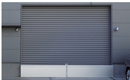
着脱式の間接支柱を用いて幅3mを超えるシャッター部にも設置可能