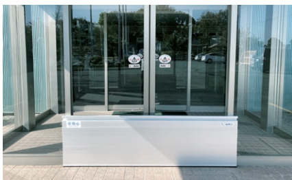
門や扉の前に設置