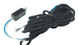
モニタプラグコード