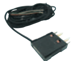
試験プラグコード