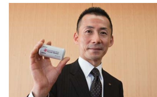
サンダーブロッカー SPR-TB-CAT5e