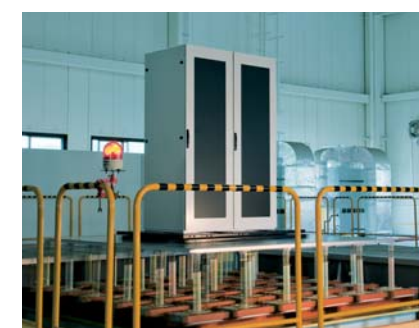
三次元地震波発生装置

雷害対策や地震対策など各事業を専門にしている企業は、数多く存在します。しかし製品の製造販売からシステムの企画・設計、保守・工事・コンサルまで、ワンストップかつ複合的にBCPや危機管理を支援できるのが当社の強みです。