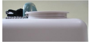
注入口キャップの閉栓