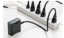
電源コンセント用SPD

電源コンセント用SPD(TBP-2PE)をOAタップに接続すると、OAタップ内で雷保護回路が並列になり、OAタップに接続する全ての機器の電源回路を保護できます。