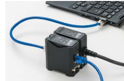
電源コンセント用SPDと LAN用SPDの接続例

多様な設置箇所(デスク上、レール、ネジ)に対応します。SPDを複数連結できます。デスク上においても違和感のないシンプルなデザインです。